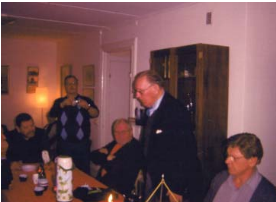
Bild från överlämnandet