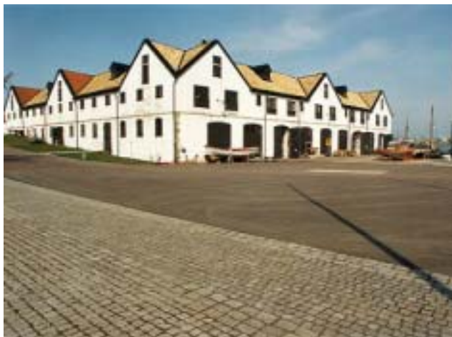
Slup- och barkasskjulet.

Slup- och barkasskjulet uppfördes 1786 på den plats där flottans artilleriverkstäder en gång legat. Dessa hade på 1730-talet flyttat in på varvsområdet. Under en kort period därefter fanns skjul för galärer. Slup- och barkasskjulet är konstruerad av C P Nyman och är 60 x 60