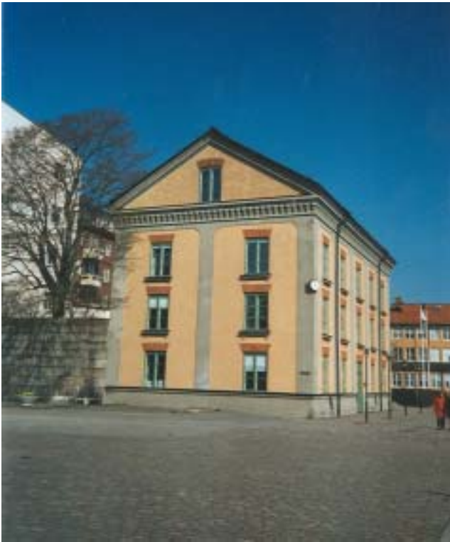
Hollströmska magasinet.