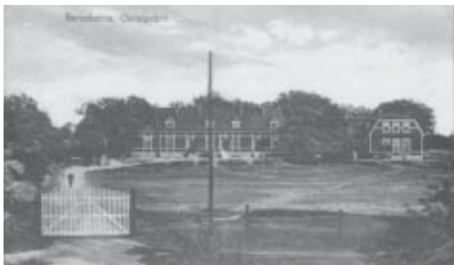
Oscarsvärn i början av 1900-talet. Arkivbild

De fasta försvarsanordningarna på Oscarsvärn utgick ur krigsorganisationen i samband med 1925 års försvarsbeslut.