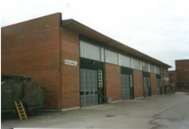
Artillerihallen, idag gym m.m.