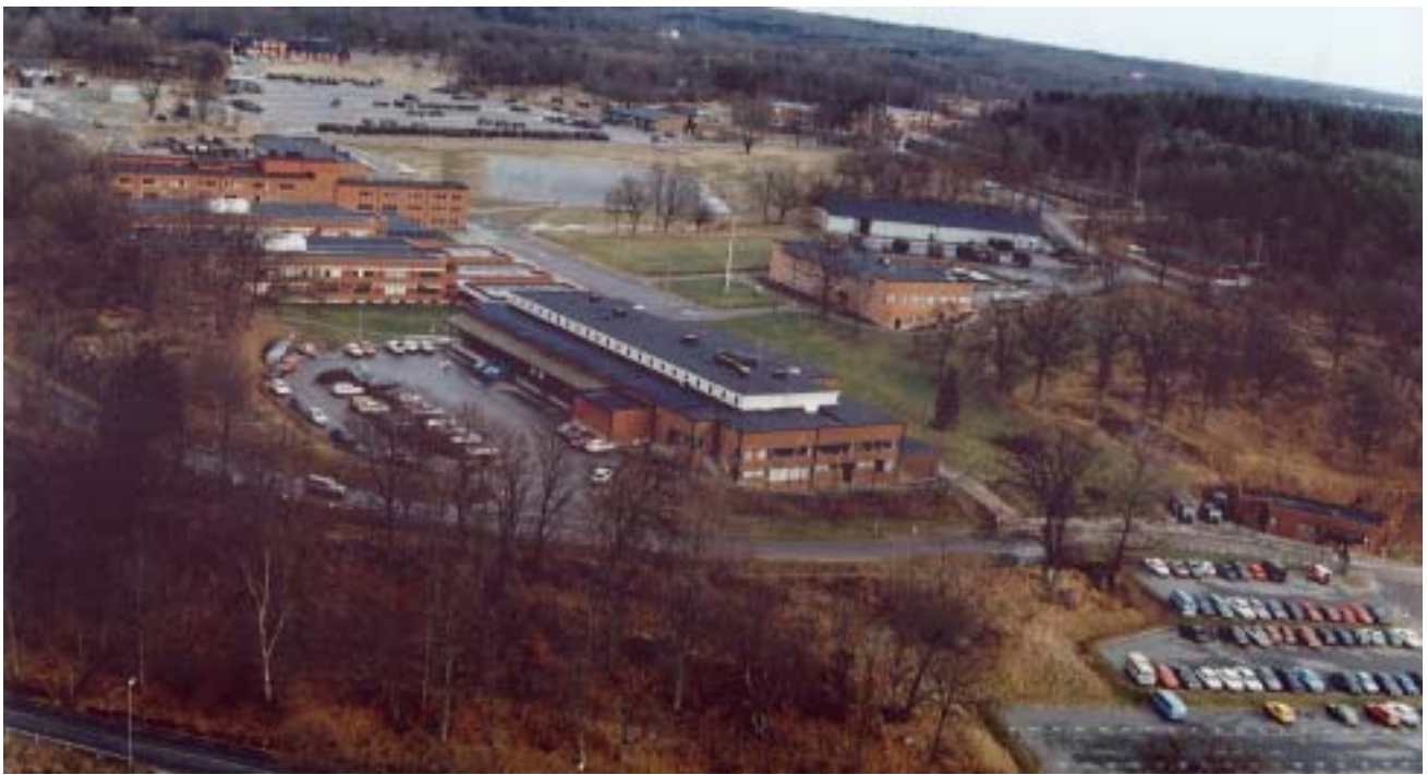
Rosenholm från luften på 1990-talet.

ta hand om nedlagda regementsområden. Successivt har demrådet sjuder av liv därutöver, genom att många småföretag etablerat sig på platsen.