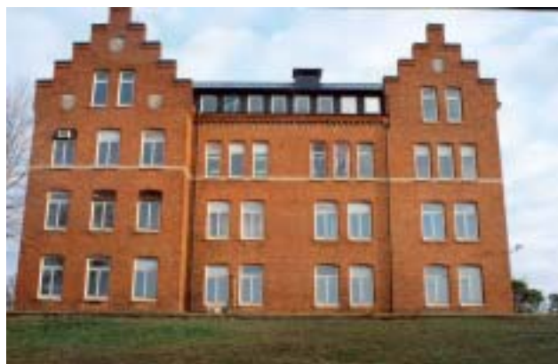
Blå Port (Ingenjörskasernen).

Efter kriget blev KA 2 huvudanvändare men området använde också för viss utbildning inom flottan. Fram till mitten av 1960-talet disponerade kronan endast området söder om Silletorpsån. Det på 1960-talet införda nya värnpliktsutbildningssystemet (VU 60) innebär ökade