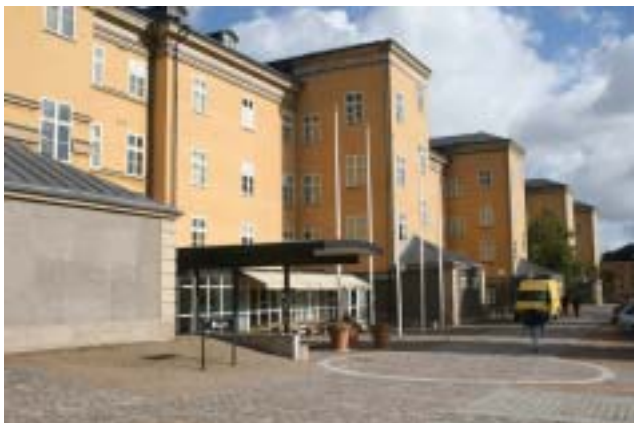
Sparre 2009.