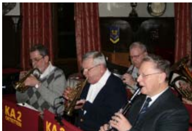
KA 2 oktetten spelar under samlingen.