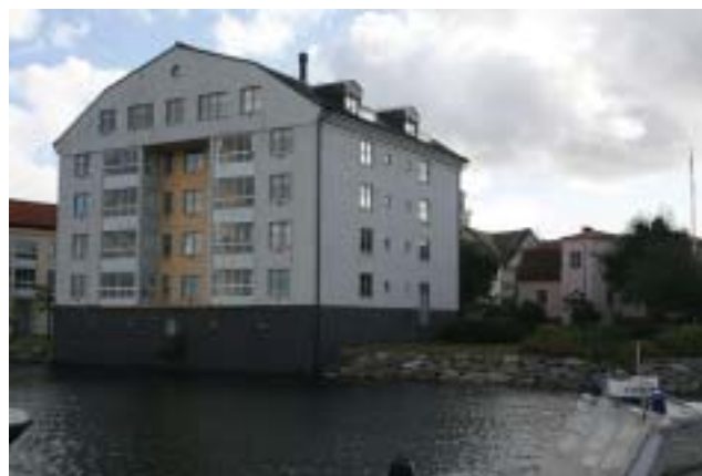
Nära havet vill jag bo.

En stor händelse var när nya Marinmuseum invigdes 1997. Publik tillströmningen till museet har varit mycket stor och besökare har också kunnat njuta av den vackra och historiska miljö, som Stumholmen utgör.