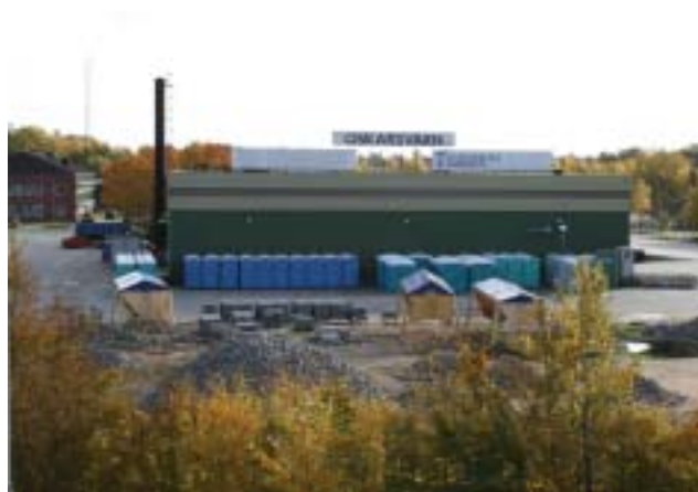
Oscarsvärn i dag.

Oscarsvärn överlämnades till Karlskrona kommun 1973, sedan KA 2 verksamhet flyttat till nya anläggningar i Rosenholm.. Idag används området som kontor, verkstäder, garage, förråd m.m. för Karlskrona kommuns Tekniska förvaltning. En del gamla byggnader används ännu, men i området har byggts garage, kontorslokaler, verkstäder, förråd m.m. Området är i dag delat av stora infartsleden. Det gamla batteriet vid Sunna finns till stora delar kvar och ägs av kommunen. Hästobatteriet på Koholmen är kringbyggt av kommunens stora reningsverk.