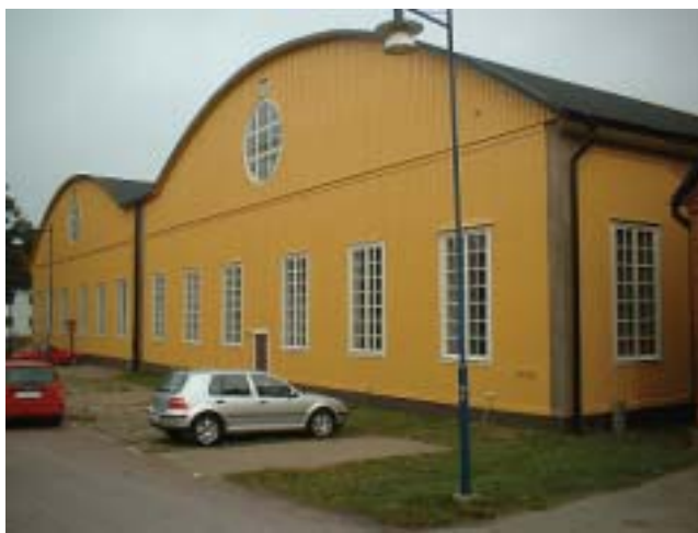
Flyghangar 4.

Hangarerna 1 och 2 är i dag rivna, hangar 3 används av Kustbevakningen och hangar 4 av Marinmuseum.