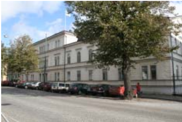
Kanslihuset 2009.

I Sparres gymnastiksal spelades elithandboll (allsvensk och division II) från handbollens barndom på 1920-talet fram till 1958, då Karlskronas nya idrottshall stod färdig. Denna hemmaarena var fruktad av alla gästlag för sitt välvda golv, byggt som ett fartygsdäck och för närheten till publiken.