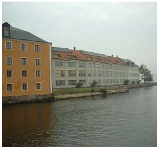
Gamla bageriet (Beklädnadsförrådet) och Beklädnadsverkstaden från Stumholmsbron.

Verkstadsdelen är i dag ombyggd till bostäder och i administrationsdelen huserar civila företag.