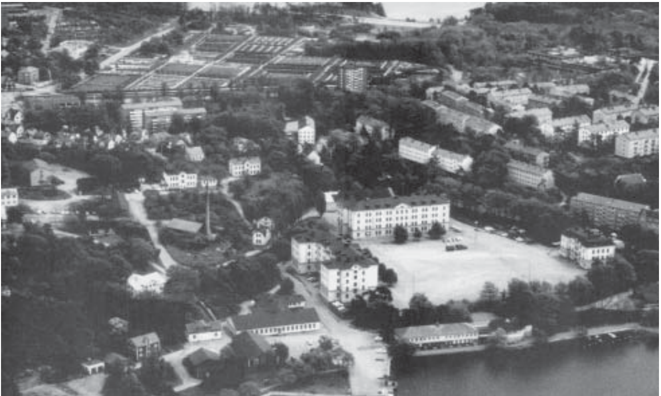
Gräsvik från luften 1977.

Från början omfattade kasernområdet endast nedre plan med några byggnader i sluttningen åt norr.