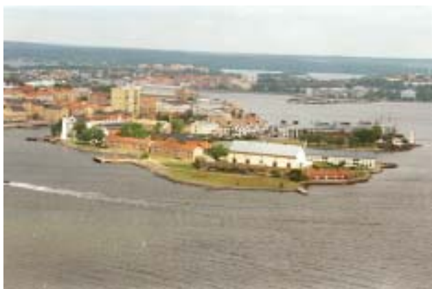
Stumholmen från söder.

Stumholmen kan liknas vid en stor försörjningsinrättning, som skulle se till, att den enskilde sjömannen och soldaten fick den mat, utrustning m.m., som erfordrades såväl i krig som i fred.