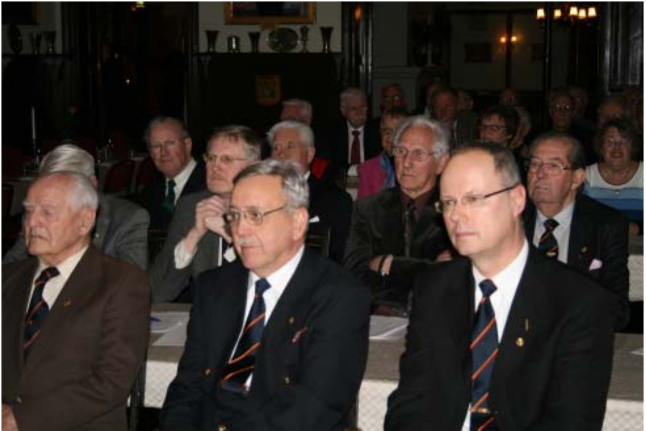
Årsmötesdeltagare ivrigt lyssnande under årsmötesförhandlingarna.