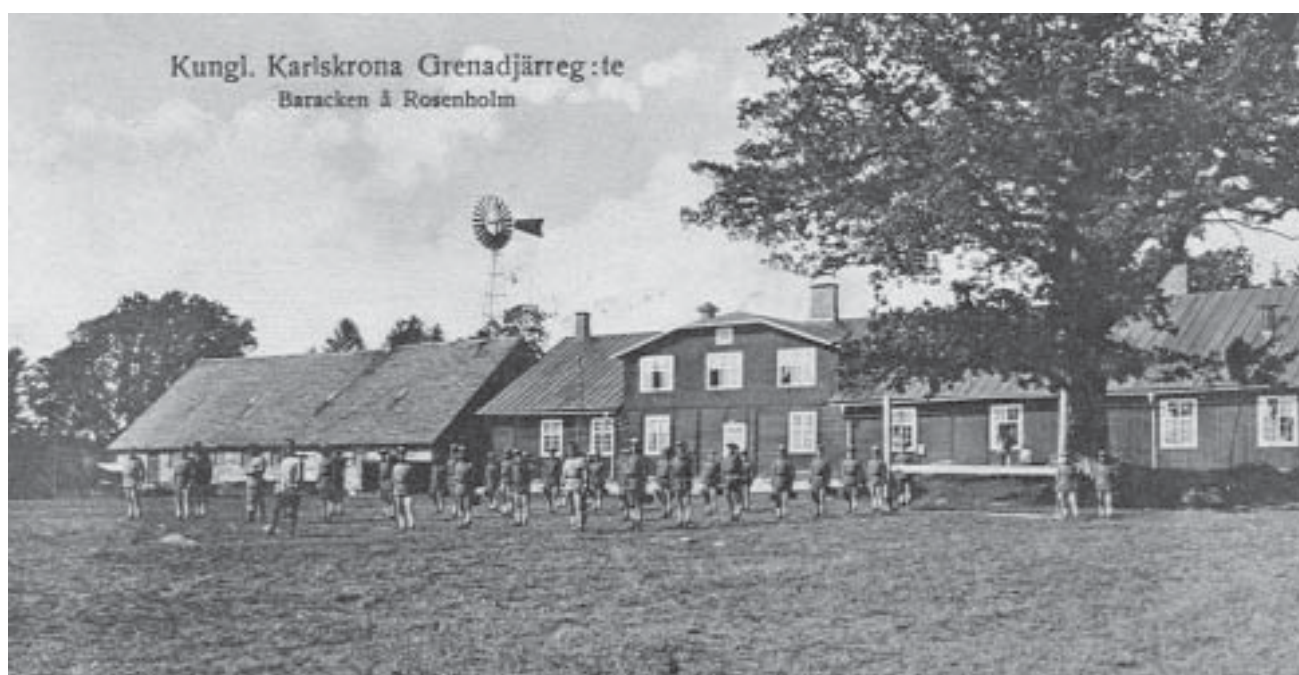
Rosenholm på 1910-talet. Arkivbild

Efter KA 2 nedläggning övertas området av fastighetsbolaget Wasallen, ett bolag som bildats enbart för att