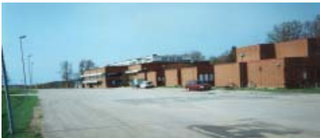
Kasernerna och matsalsbyggnaden.