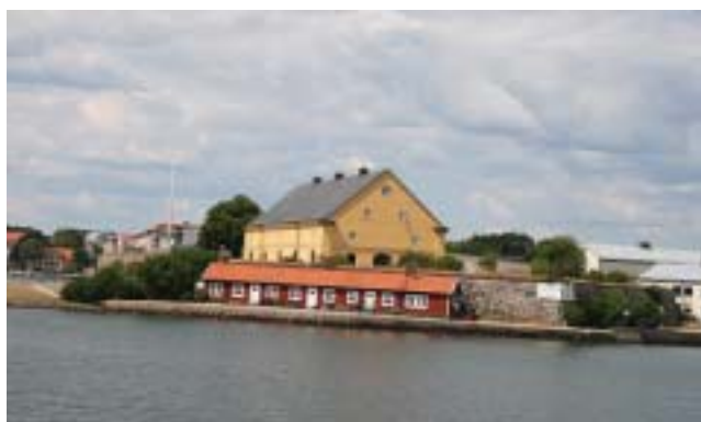
Kungshallsmagasinet från öster.

Från 1990-talet fram till 2009 har Blekinge museum använt byggnaden som magasin. Huset är numera sålt till privat fastighetsägare och många väntar med spänning på framtiden för detta unika hus.