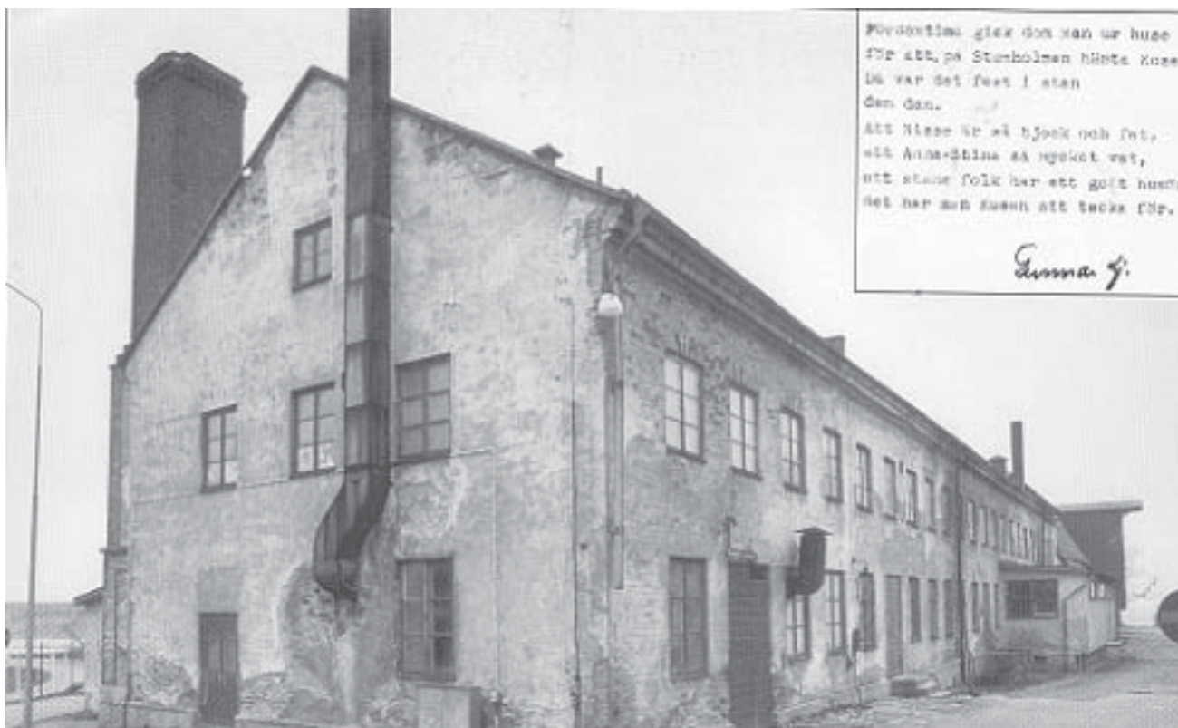
Nya kronobageriet. Arkivbild

Kungshallsmagasinet ett proviantförråd, varifrån många militära förband i södra Sverige försörjdes in på 1980-talet.