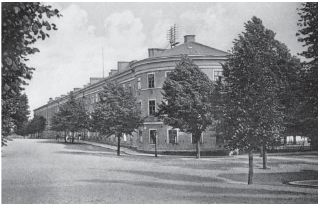
Kasern Sparre kring 1910. Arkivbild

Prinsgatan. Exercishuset förlängdes 1902 såväl åt öster som åt väster.