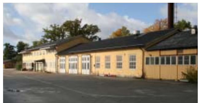
Verkstadsanläggningen på Bockanäset.