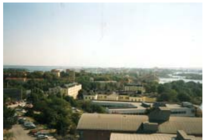
Översiktsbild över Gräsvik 2002 tagen från Telenors mast.

Successivt under åren efter 1981 utökades den civila verksamheten på Gräsvik. En del gamla byggnader revs, medan andra byggdes om för nya ändamål. Ett antal stora nybyggnader skedde dessutom som t.ex. Telenors stora anläggning på övre plan, länken mellan Östra och Norra kasern, nytt bibliotek där kök och matsal en gång låg samt, när detta skrives, ny stor byggnad längs Dannemarksfjärden för att kunna hysa den del av högskolan, som i dag finns i Ronneby.