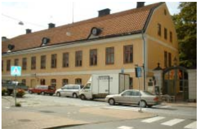
Kungshuset.

Kungshuset. En speciell händelse i husets historia inträffade hösten 1809. Då tillbringade den avsatte kungen Gustav IV Adolf en tid i Kungshuset som gäst till befälhavande amiralen Johan af Puke, innan han på julaftonen lämnade landet ombord på fregatten Camilla.