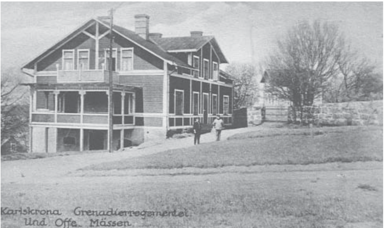
Underofficersmännen i början av 1900-talet. Arkivbild