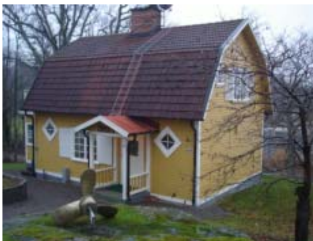
Föreningshuset Saga på Skönstavik