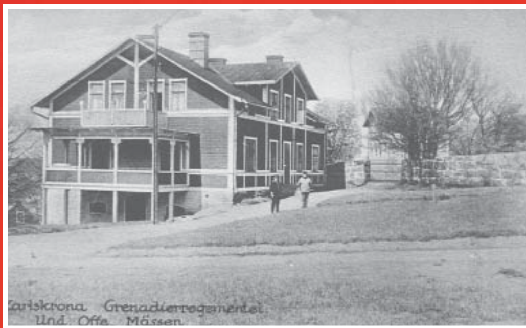
Zariskrona Grenadierregimentet. Und. Offe. Mössen.