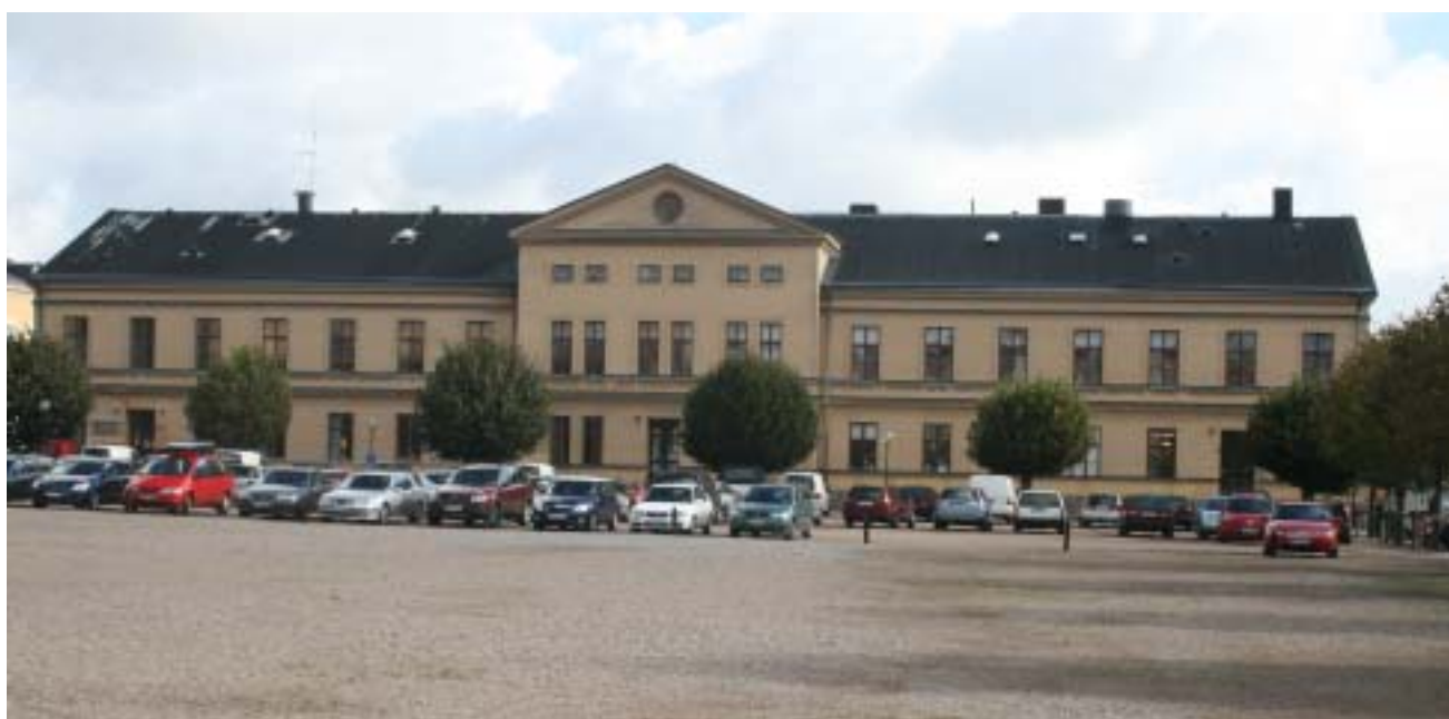
Kokhuset och kaserngården 2009.

Åren efter 1984 skedde en omfattande "civilisering" av