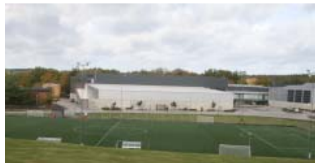
Arena Rosenholm.

Rosenholm är ett utmärkt exempel på, hur man omvandlar ett nedlagt kasernområde, till ett område som sjuder av liv.